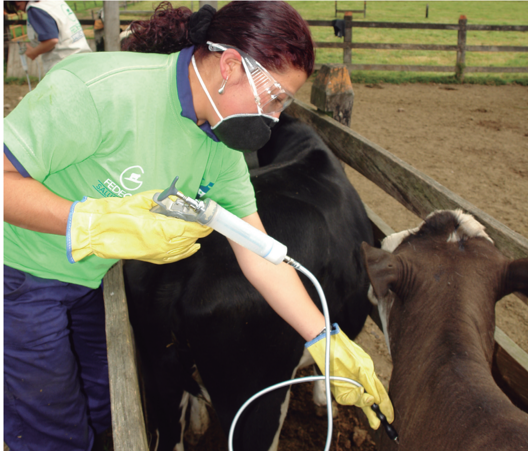
Sin el programa de vacunación que hizo que actualmente Colombia sea un país libre de aftosa, no se habrían podido realizar las exportaciones ganaderas.